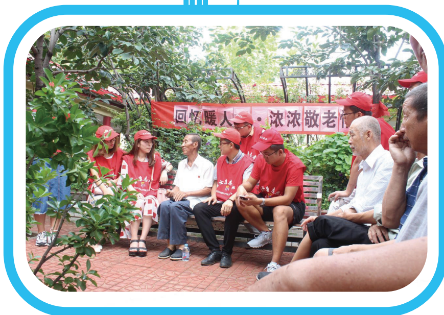
探訪龍河長者之家