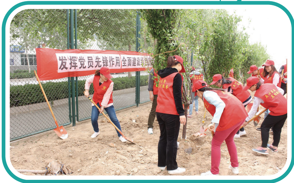
於中國業務所在廊坊市進行植樹活動