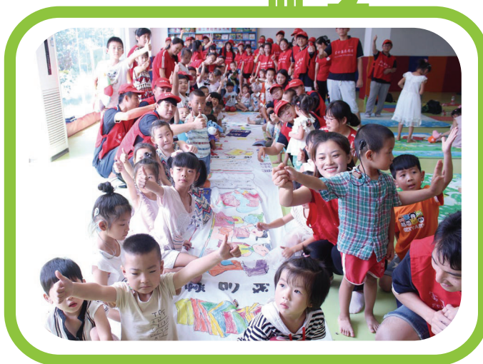
於睿聰聾兒康復中心與兒童 度過開心的一天