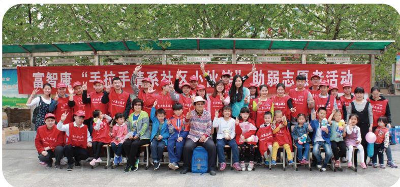
於「手拉手情繫貧困小伙伴」 全國統一行動日的義工活動